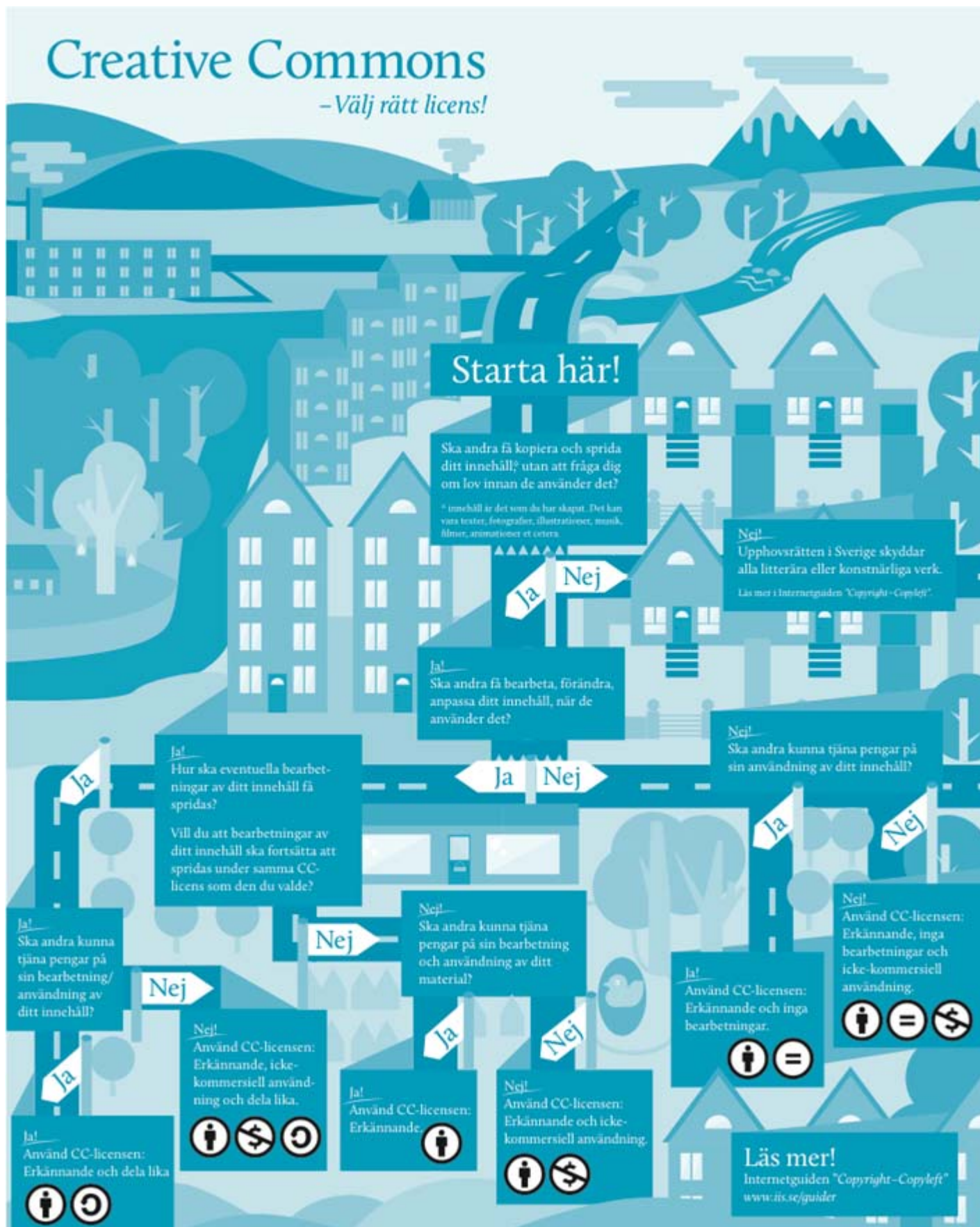
Fig 4. Creative Commons – välj rätt licens (Stiftelsen .SE)

licens som passar just ditt verk ( https://www.iis.se/docs/Creative-Commons-Webb.pdf ).