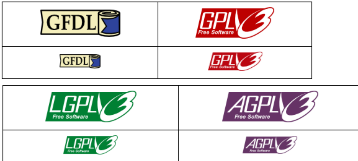
Fig 6 GNU licenser

All information om GNU General Public License du kan tänkas behöva finns att läsa på GNU-projektets webbplats: http://www.gnu.org/